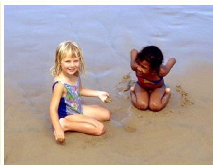
Weiß und Farbige entdecken das Miteinander.

4. Ein gewaltiges Zeichen der Hoffnung: das Christentum wird international. Es ist nicht mehr auf die „weißen“ Völker Europas, Amerikas und Australiens beschränkt. Die Mehrzahl der Christen lebt heute in der sogenannten Dritten Welt – oder sagen wir: der südlichen Hemisphäre. Und diese Christen emanzipieren sich von der Vorherrschaft der europäischen oder amerikanischen Christen. Für die katholische Kirche: der Papst stammt zwar noch nicht aus der Dritten Welt, aber er ist seit 1978 kein Italiener mehr. Wer den langsamen Schritt der katholischen Kirche kennt, wird das zu würdigen wissen. Die jungen Kirchen sind keine Kolonialkirchen mehr, sondern zeigen ihr eigenes Profil. Sie nehmen nicht nur, sondern geben auch.